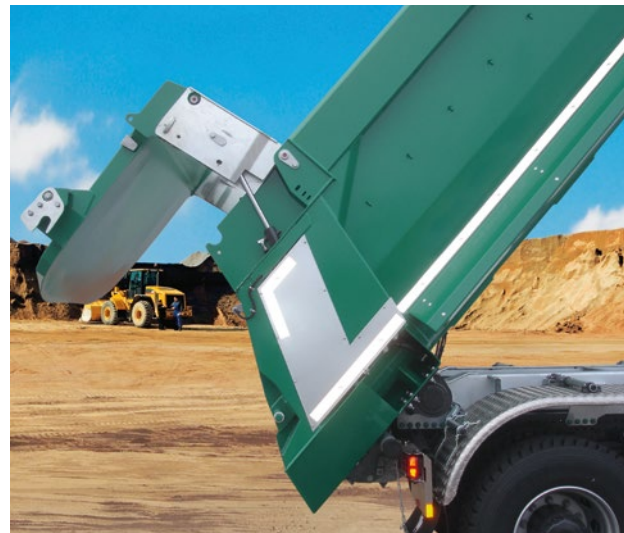
Die hydraulische Pendel-Klappe an den robusten Stahl-Rundmulden erlaubt das sichere Entladen auch sehr großer Steine.