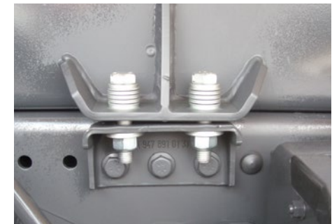
Verbindung von Hilfsrahmen und Chassis nach den Aufbau-Richtlinien des Fahrzeugherstellers, hier mit Tellerfedern.