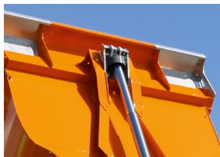
Für zuverlässige Kippvorgänge: Der Niederdruckzylinder mit geschütztem Kardangelenk.