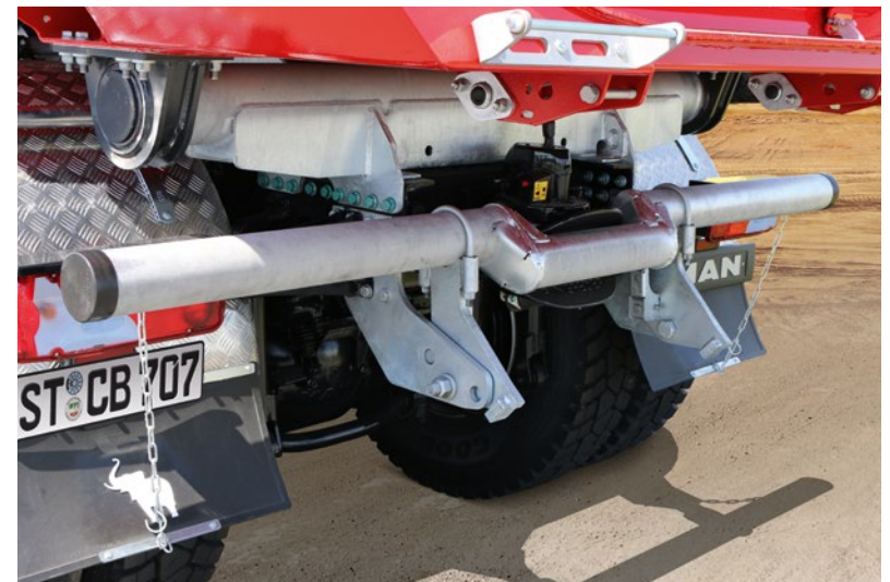
Gekröpfter Unterfahrschutz in hochgeklapptem Zustand.