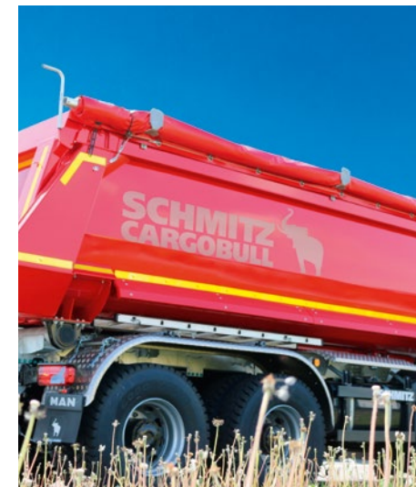
Aluminium-Leiter in Parkposition seitlich am Langträger.*