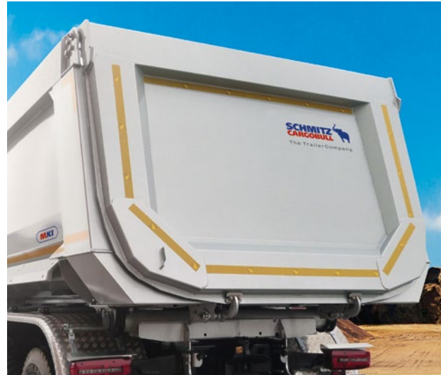
Die aufliegende Pendel-Klappe vereinfacht Teilentladungen und ist optional, genauso wie die innen liegende Pendel-Klappe, mit hochgesetztem Pendel-Lager lieferbar.