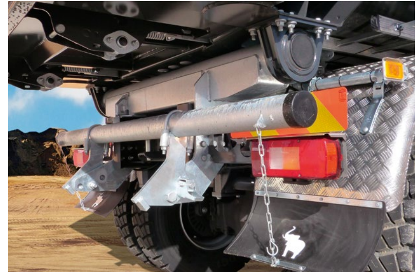
Hochgeklappter Unterfahrschutz für das Entladen am Straßenfertiger.