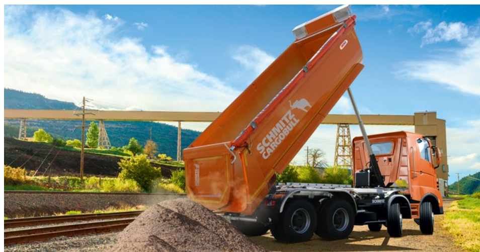
Der breite Bodenbereich der Schmitz Cargobull Stahl-Rundmulde ermöglicht einen niedrigeren Fahrzeugschwerpunkt.