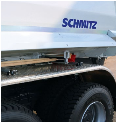
Seitliche Abweisbleche an der Stahl-Rundmulde schützen beim Beladen den Fahrwerksbereich, die Tanks, den Luftkessel und die Batterien.