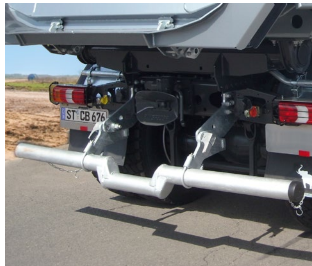
Optional lieferbar: Gekröpfter, klappbarer Unterfahrschutz für Fahrzeuge mit Anhängerkupplung.