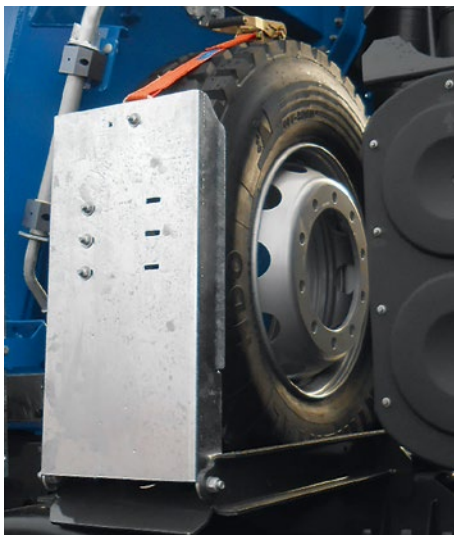
Schnell zugänglicher Ersatzradhalter in Windenausführung zwischen Fahrerkabine und Mulde.

Die Abbildungen zeigen weiteres Zubehör, das speziell für die harten Anforderungen des Arbeitsalltags entwickelt wurde.