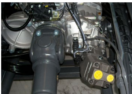
Am Nebenabtrieb des Lkw-Motors wird die Hydraulikpumpe angeflanscht.