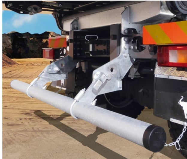
Der robuste, klappbare Unterfahrschutz.

Ob klappbarer Unterfahrschutz für die Arbeit am Straßenfertiger oder Ersatzradhalter und auch Mulden-Heizung – die richtige Ausstattung und ein smartes, anwendungsgerechtes Zubehör machen den Unterschied im Arbeitsalltag.