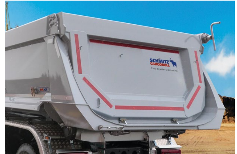
Die Schütte der innen liegenden Pendel-Klappe ermöglicht ein zentriertes Entladen.