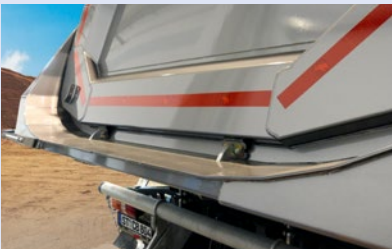
Verriegelungshaken an der Heckklappe.