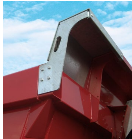
Das Vordach am vorderen Obergurt wirkt Schäden durch überfließendes Schüttgut entgegen.