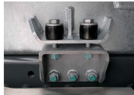
Elastische Verbindung mit Silentbuchsen.