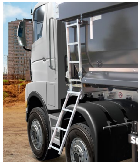
Seitliche Aufstiegsleiter für die Ladungskontrolle.