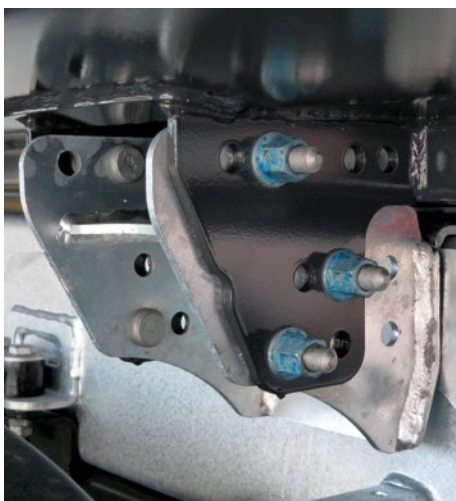
Mulden-Einweiser unterstützen das zentrierte Aufsetzen und die seitliche Sicherung.