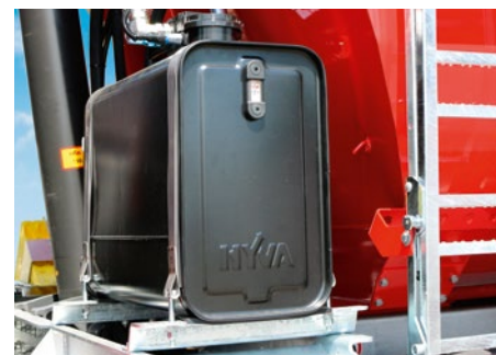
Der Hydrauliktank ist anwenderfreundlich und sicher in den Aufbau integriert.