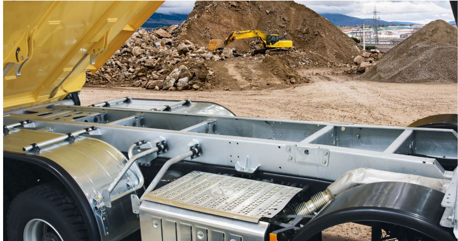
Der extrem torsionssteife Hilfsrahmen macht Fahrzeug und Aufbau zur hoch belastbaren, sicheren und effizienten Einheit.

In der Regel ist der Hilfsrahmen zum Korrosionsschutz verzinkt. Alternativ kann eine hochwertig lackierte Ausführung bestellt werden.